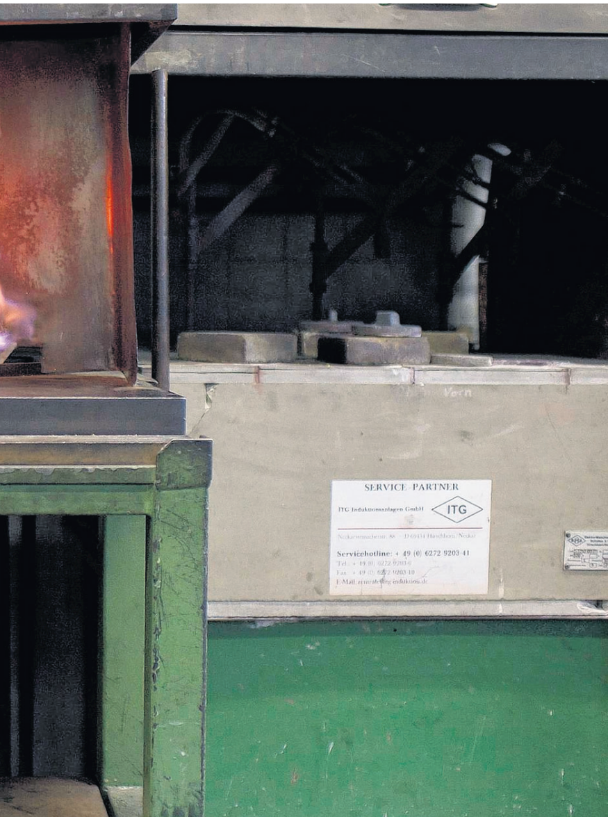
waar ook ter wereld.'