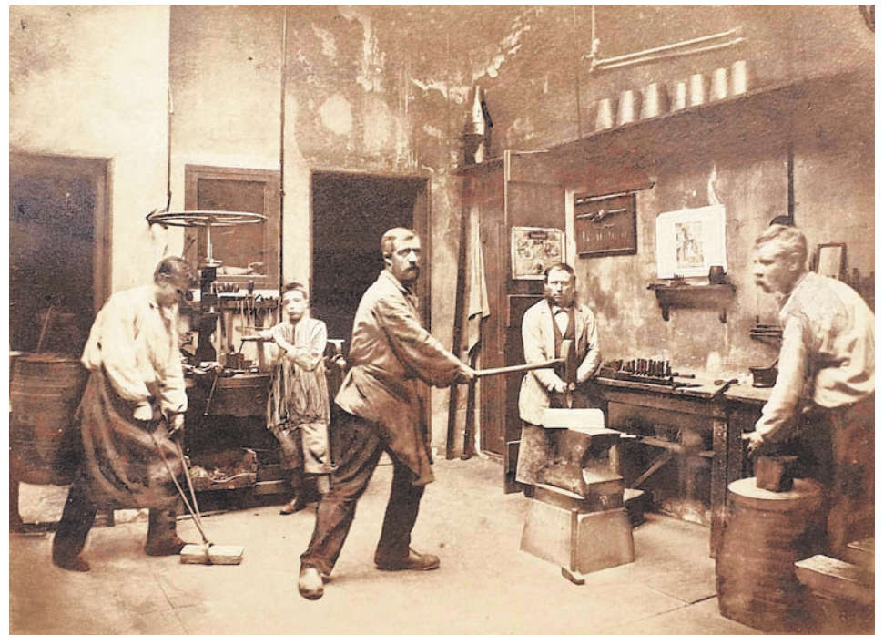
De oude smelterij van Schöne, tot 1922 gevestigd op het Rokin.

Tegenwoordig is zo iets ondenkbaar. Bezoekers die een rondleiding willen, moet Appel teleurstellen. "Niet dat we iets te verbergen hebben. Maar in de wereld van het edelmetaal draait alles om vertrouwen."