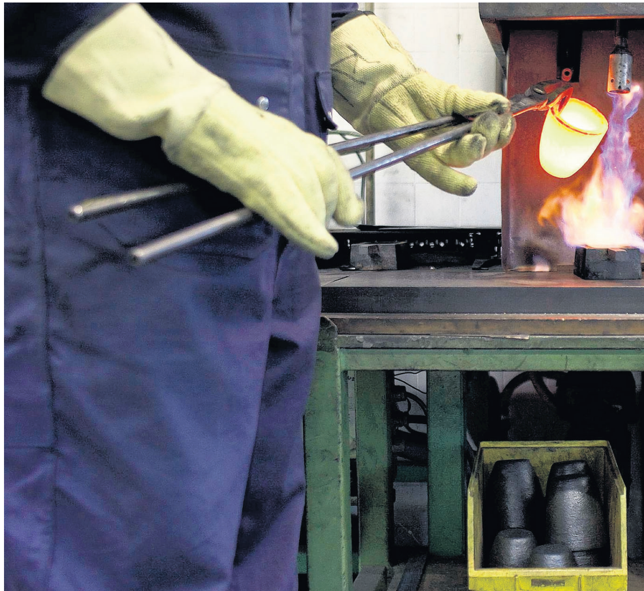
Het smelten van goudbaren bij Schöne Edelmetaal. ‘Wie met een staaf goud van ons naar een bank gaat, krijgt meteen zijn geld,

Alle transacties in edelmetaal op de optiebeurs, die toen net was op-